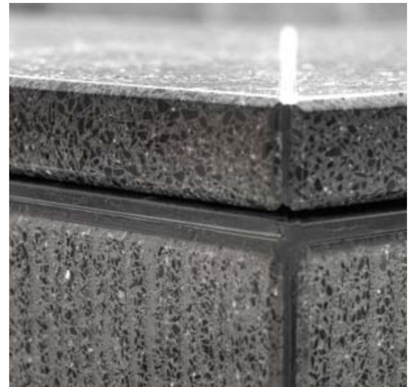
LUCEM LINE anthrazit