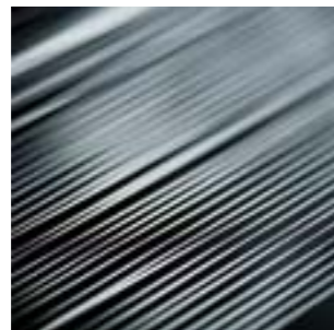
Lichtleitfasern optical fibers