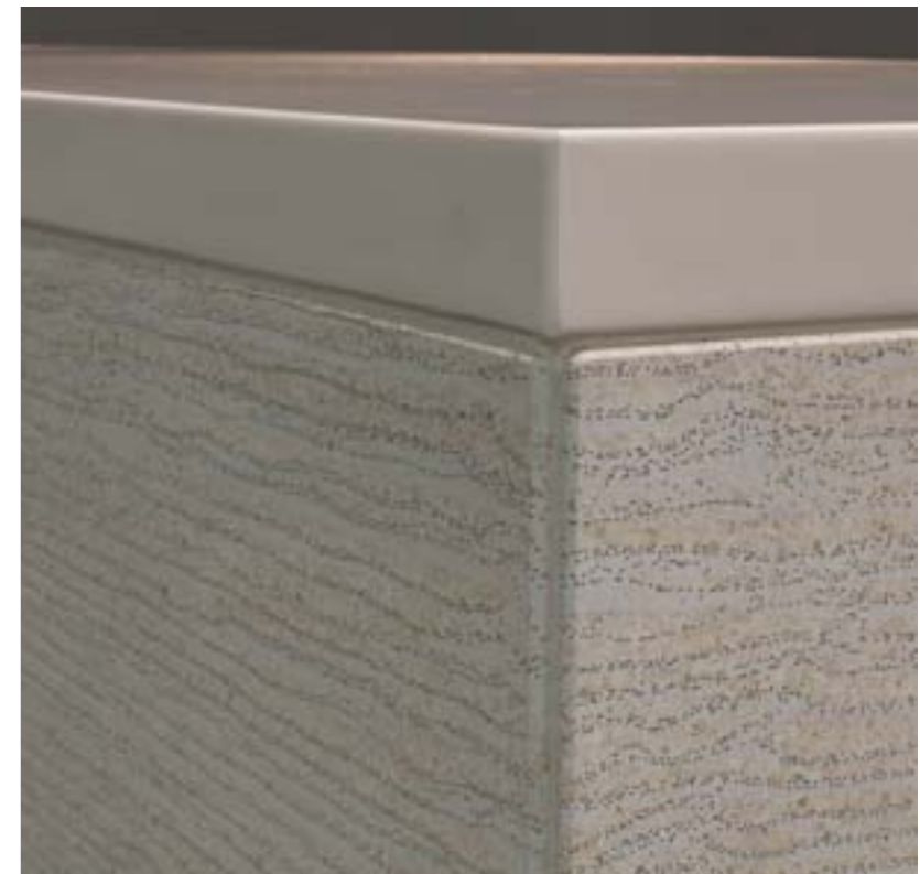
LUCEM LINE weiß