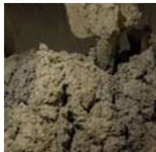
Beton mischen cement mixing

LUCEM invites one to the examination of light and shadow, transparency and massivity, artificial or natural light both, inside and outside. In this, there are nearly no limits for the architectural methods.